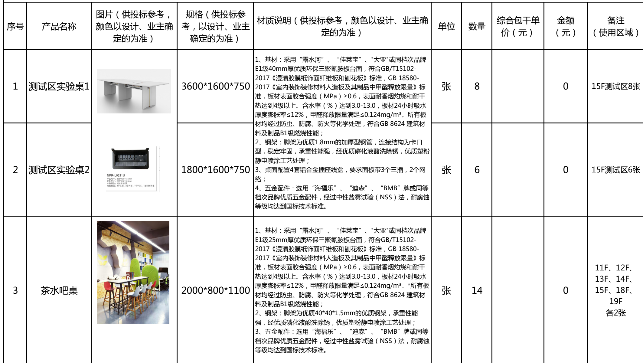
互联网产业园二期（渝兴产业基地拓展区）7号楼第11-19层办公家具采购明细清单报价表